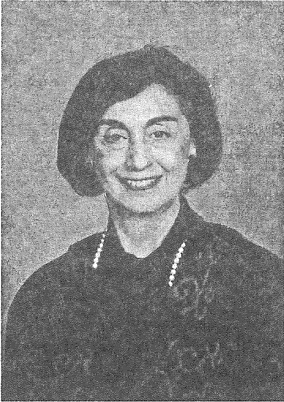
Domnul este fidel zi de zi