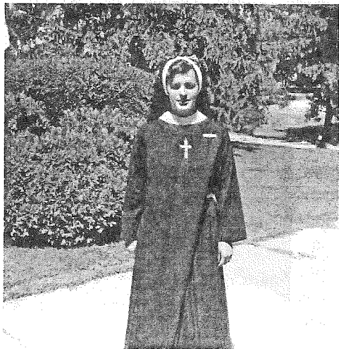
Mă simțeam închisă ca într-o cușcă

De-a lungul celor treisprezece sau paisprezece ani care au urmat, am luptat, recunoscînd că eram captivă în gîndurile mele, în sentimentele mele și în toată viața mea interioară. Am sfîrșit prin a înțelege că eu căutam să fac ce așteptau oamenii de la mine, dar că Dumnezeu avea un alt plan pentru viața mea.