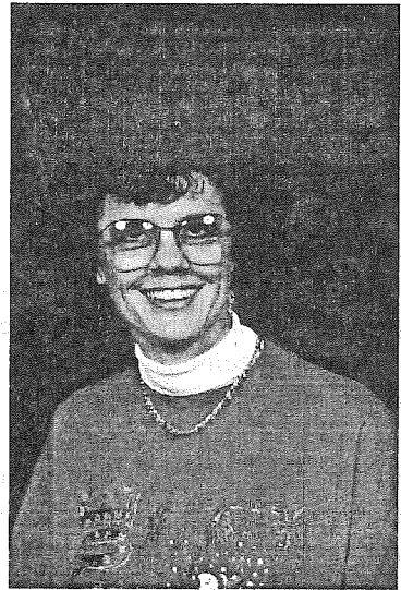
Îl laud cu adevărat pe Dumnezeu pentru fidelitatea Sa față de mine

Dorința mea este să fiu ascultătoare de Dumnezeu și să cresc în credință. Știu că lucrul acesta nu este posibil decît prin grația Sa, și mă bazez pe ajutorul Său. Ce bucurie să descopăr zi de zi adevărul Cuvîntului Său și numeroasele promisiuni pe care le conține el! Îi mulțumesc din toată inima că S-a ocupat de mine cu atîta fidelitate!