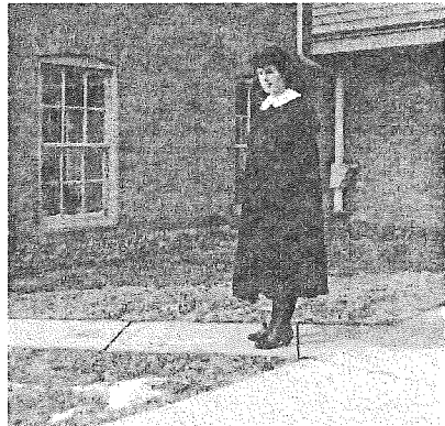
Pregătindu-mă de călugărie

La început, convingerea că am fost chemată de Dumnezeu m-a ajutat să înving îndoielile și obstacolele cu care eram confruntată în această nouă viață. Totuși, cu timpul, ochii și inima mi s-au deschis în fața zădărniceii rugăciunilor învățate pe de rost și a diverselor ritualuri. Propriul meu păcat, ca și cel al altor călugărițe, mă tulbura, căci lumea credea despre noi că trăim în sfințenie. Ușa spre libertate se deschidea adesea, dar pe prag era scris cuvîntul „nesiguranță“. De fiecare dată cînd puteam