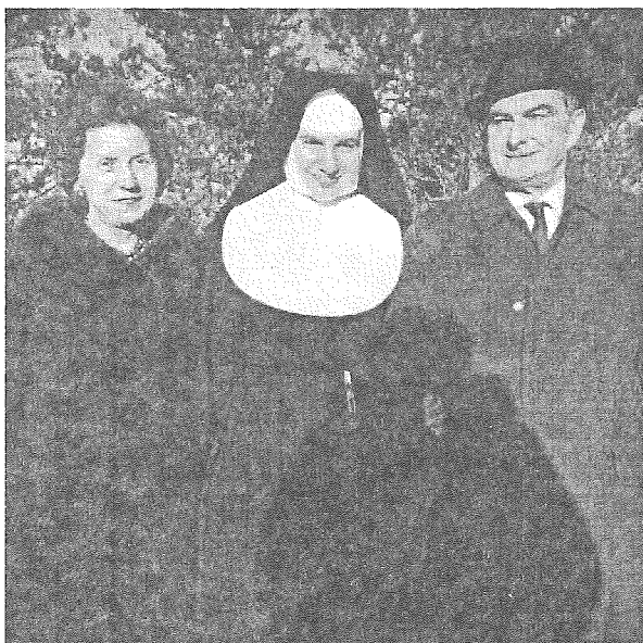
În timpul noviciatului, împreună cu părinții mei