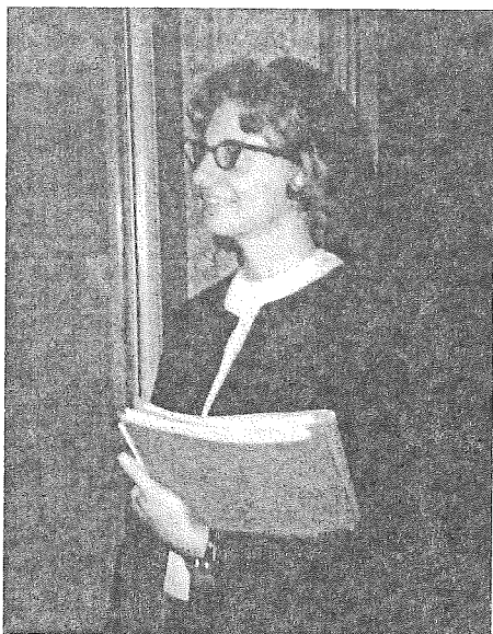
Noua rasă mai puțin restrictivă

Toate aceste schimbări mă făceau să-mi pun întrebări privind caracterul arbitrar al regulamentului nostru. Cum puteau fi niște reguli atât de importante astăzi, iar în ziua următoare să fie complet abandonate? Din cauza abuzurilor comise în cursul acestei perioade de schimbări, a fost nevoie să fie impuse din nou anumite măsuri disciplinare. Niște surori mai în vîrstă, aflate într-o poziție de autoritate, s-au văzut confruntate cu probleme grave. De exemplu, în timpul primului meu an de profesorat la o școală parohială, s-au „mirosit“ în casa noastră mamă niște „reuniuni amicale“ între preoți și călugărițe, în care ei dansau și se