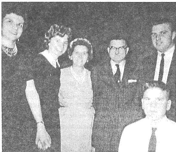
În primul an ca postulantă, primind vizita familiei

erau citite. Primii ani de pregătire erau supuși unor reguli foarte stricte.