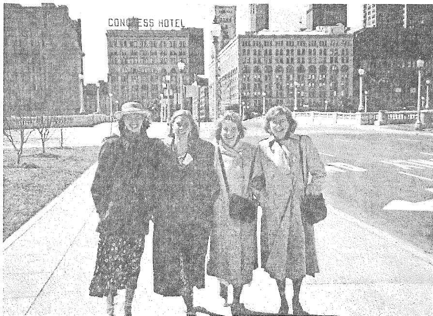
Cele trei fiice ale noastre și cu mine

sia că trăim într-o agitație permanentă.