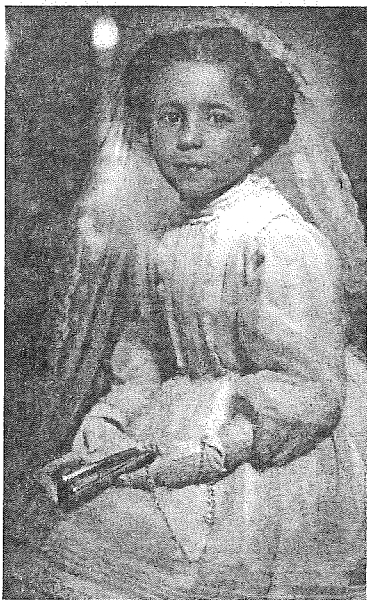
Ziua primei mele împărtășanii

Cînd am împlinit doi ani, am fost plasată împreună cu două dintre surorile mele într-o școală cu internat afiliată unei mănăstiri. Această instituție, în care ne petreceam săptămîna, era condusă de călugărițe care predau într-o școală publică. La sfîrșitul săptămîinii reveneam la părinții noștri. Mama