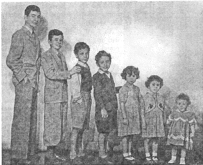
Dintre toți frații și surorile mele, eu sunt cea mai mică