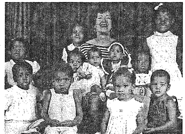
Santo Domingo, îngrijindu-se de copiii abandonați