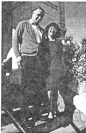
Cu soțul meu drag

unui plan special al lui Dumnezeu pentru el: lucrul acesta nu i-a fost impus de vreo instituție, de vreo autoritate omenească. În schimb, religiile păgâne și idolatre din antichitate obligau anumite persoane la celibat. Mai târziu, Biserica Catolică n-a făcut decât să reia aceste practici. Versetele din Matei 19:11-12 arată că cel care decide să rămână celibatar trebuie s-o facă liber, ca răspuns la o vocație specială.