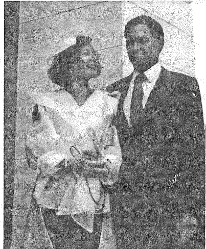
Ziua cununiei noastre

Dacă cineva decide să rămână celibatar, trebuie s-o facă cu toată libertatea și nu sub o constrângere exterioară. Desigur, există excepții, profetul Ieremia de exemplu. Dar lucrul acesta se datora