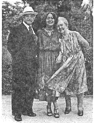
Cu părinții mei cînd am terminat școala sanitară

Acest studiu aprofundat al Bibliei mi-a adus o mare pace și un adevărat echilibru emoțional, chiar dacă trebuia să lucrez și să studiez din greu. Dar acest efort era o bucurie și nu o povară. A cunoaște Cuvîntul și a-mi conforma lui viața, ce sursă inepuizabilă de binecuvîntări! Începeam să înțeleg ce voia apostolul Paul să spună cînd afirma: