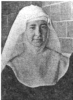
În ziua cînd am îmbrăcat rasa Clarisselor