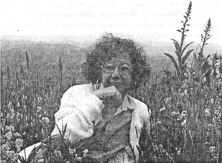
Mie nu mi-e rușine de evanghelia lui Cristos

Adresa ei: P.O. Box 703, Dallas OR 97383-0703, Statele Unite