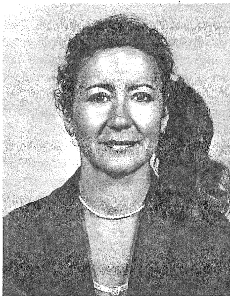
Vălul mi-a căzut de pe ochi

acesta am fost ridicată din întuneric și dusă la lumina Sa minunată, am trecut de la păcat la iertare, de la moarte la viață! Minunată grație a lui Dumnezeu oferită tuturor celor ce cred în Cristos! Această grație m-a regăsit pe mine, oaia pierdută, fiica risipitoare, și m-a readus în brațele Tatălui. Și, în dragostea Sa necondiționată, Tatăl m-a primit.