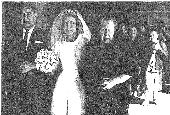
Ca mireasă a lui Cristos cu familia mea în interiorul mănăstirii

Încercasem să ne convingem pe noi înșine că surorile izolate erau „crema cremei“ vieții mănăstirești. Cu toate acestea, mă izbeam tot mai mult de niște realități care dezmințeau această convingere. Numeroasele noastre regulamente și precepte erau asemănătoare cu cele ale fariseilor, acești oameni religioși care Îl disprețuiseră atât de mult pe Domnul. De exemplu, existau discriminări între călugărițe și vizitatori, între familii bogate și sărace. De