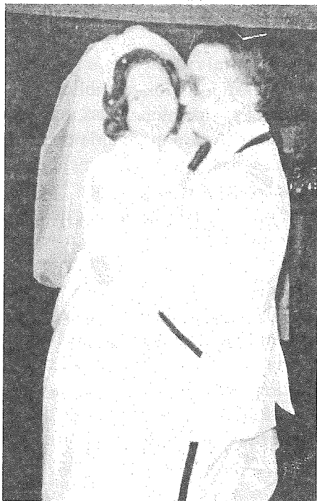
Ziua cununiei noastre

Singură în acest apartament, sufeream de o anumită izolare. După plecarea mea din comunitate, prezența zilnică a tovarășelor mele îmi lipsea. Soluția părea să fie căsătoria, dar cei mai mulți de vîrsta mea păreau să fie deja căsătoriți. Numărul opțiunilor se micșorase considerabil în timpul anilor pe-