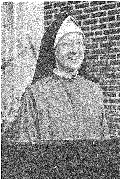
Cînd eram călugăriță

După treisprezece ani, nemaiputînd din punct de vedere psihologic să mai suport viața religioasă și mănăstirească, am cerut să fiu eliberată de jurămin-