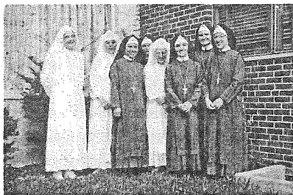
Eu sunt prima din dreapta